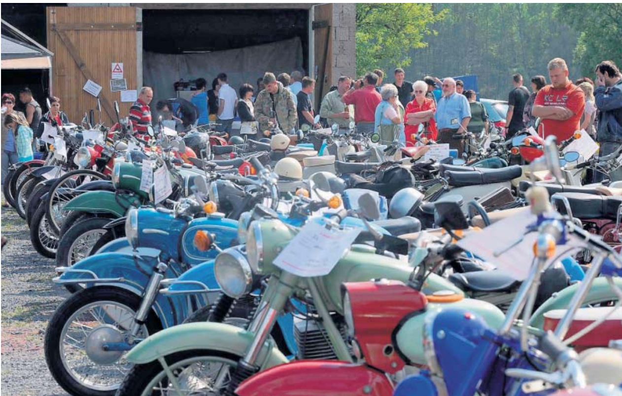
Auch Zweiradfahrzeuge konnten in allen möglichen Variationen bei der Oldtimerschau in Heubisch bewundert werden.